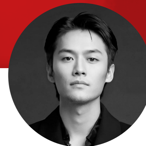
疯狂小杨哥 Feng Kuang Xiao Yang Ge

После успеха в стриминге запустил собственный бренд, а первые полгода продажи продукции под его СТМ** превысили 100 млн заказов