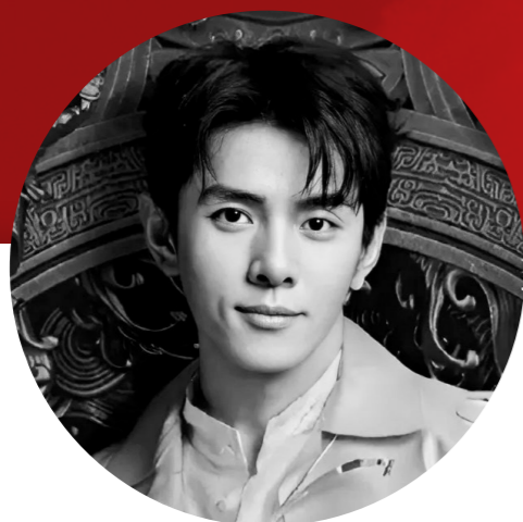
李佳琦 Li Jiaqi

В 2021 году за 12 часов продал товаров на $1,7 млрд